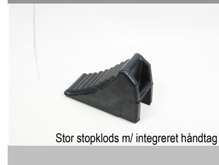
Stor stopklods m/ integreret håndtag